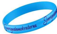
SD Armband Lager 1300st