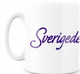
SD Kaffekopp Lager 129 st