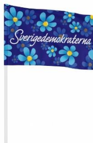
SD Handflagga Lager 550st