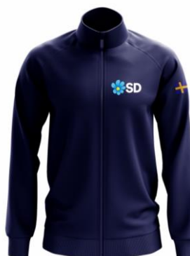
Softshell SD Jacka Blå/Vit Lager 62st