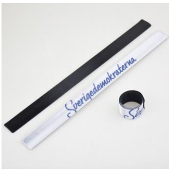
SD Reflexarmband 1291st