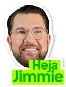
Jimmie Doftgran Lager 500st