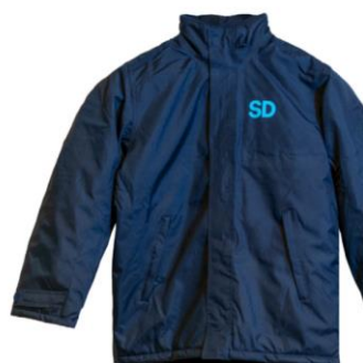
SD Jacka Dam/Herr Lager 49st