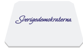
SD Isskrapa Lager 1000st