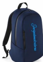
SD Ryggsäck Lager 42st