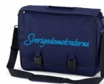
SD Mailmanväska Lager 31st