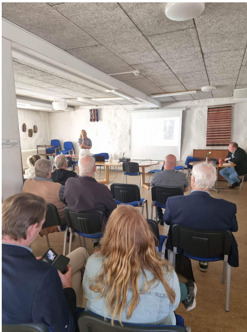
Jessica Stegrud föreläste om energipolitik.

Söndagen den 21 maj besökte riksdagsledamoten Jessica Stegrud Skåne för att föreläsa om Sverigedemokraternas energipolitik och hur den kommer utvecklas under de kommande fyra åren. Föreläsningen var ett samarbete mellan SD Skåne och SD Malmö och gavs både på Föreningarnas hus i Kristianstad och på Kockum fritid i Malmö. På så sätt kunde våra medlemmar själv välja vilken plats och tid som passade en bäst att gå på. Det bjöds även på energigivande fika på platserna.