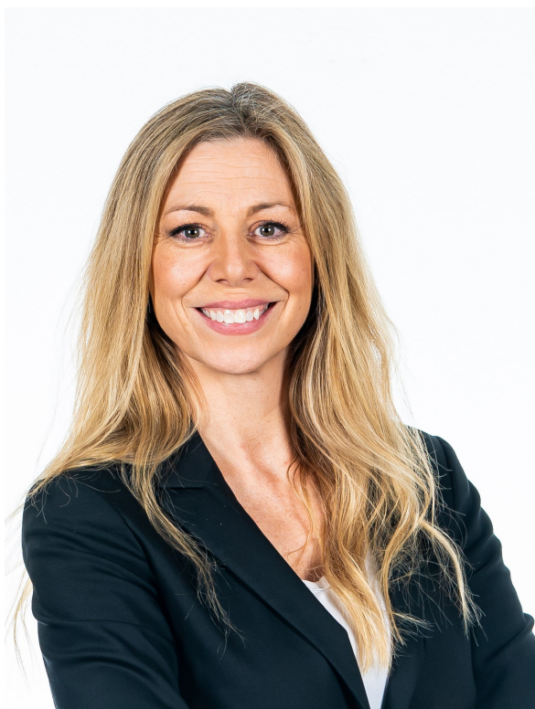
Sverigedemokraternas nya riksdagsgruppledare Linda Lindberg.

Som vice gruppledare tillträder Michael Rubbestad, som även är jämställdhetspolitisk talesperson för Sverigedemokraterna.