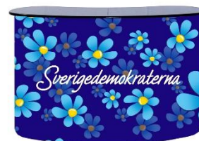
SD Njurbord Lager 5st