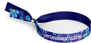
SD Tygarmband Lager 100st