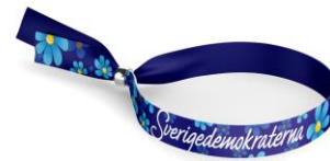
SD Tygarmband Lager 35st