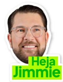
Jimmie Doftgran Lager 800st