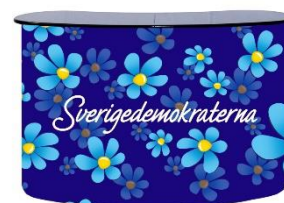
SD Njurbord Lager 5st