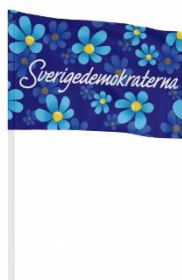
SD Handflagga Lager 300st