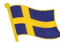
Pin Sverigeflagga Lager 195st