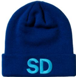
SD Mössa Lager 692st