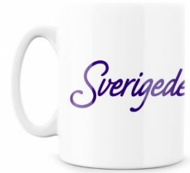
SD Kaffekopp Lager 137 st