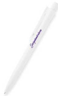
SD penna Lager 1200st