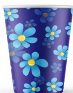
SD Pappmugg Lager 2000st