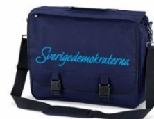
SD Mailmanväska Lager 69st