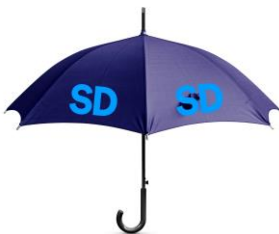
SD Paraply Lager 83st