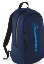
SD Rygsäck Lager 88st