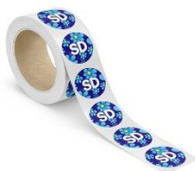
SD Klistermärke Lager 2000st