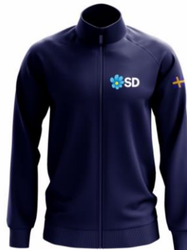
Softshell SD Jacka Blå/Vit Lager 60st