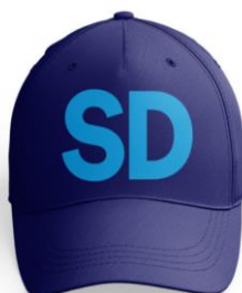
SD Keps Blå/Vit Lager 200st