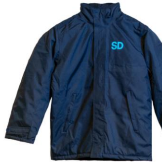
SD Jacka Dam/Herr Lager 47st