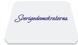
SD Isskrapa Lager 940st